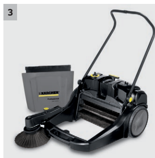
3 Groot vuilreservoir