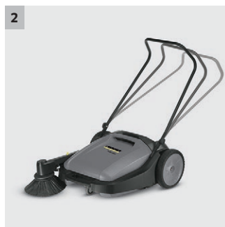
2 Instelbare duwbeugel