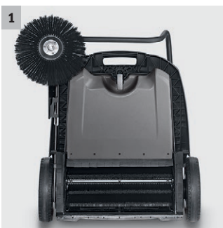
1 Aandrijving hoofdbezem